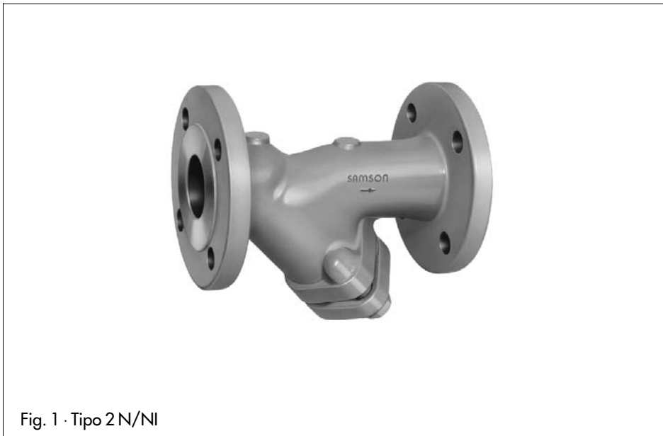
Fig. 1 · Tipo 2 N/NI